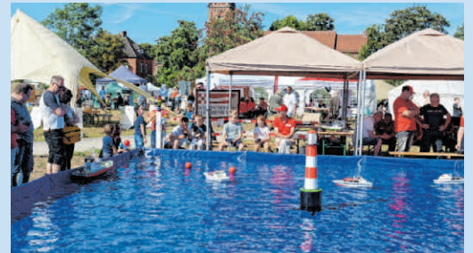
Auch in diesem Sommer lockt die HEVIE mit einem bunten Programm nach Hemelingen.

Abschließend bittet die Stadtteilmanagerin um Unterstützung für die Spielkreise in Hemelingen. Dieses Angebot droht ab Sommer aufgrund mangelnder Finanzierung eingestellt zu werden. Um dies zu verhindern, gibt es eine Petition, an die das Stadtteilmarketing erinnert. GEM/ABO